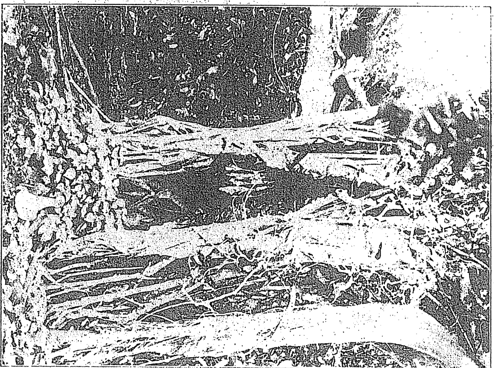
黄尾島中層層下の信天翁